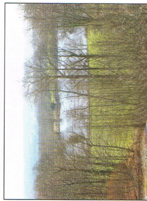
Aux environs de la forêt de la Vécau.

Durant les premières décennies du 20 e siècle encore, des colporteurs sillonnaient de long en large la campagne. Pour se rendre de Cieux à Chamborêt, ils empruntaient nombreux, de jour comme de nuit, la forêt de la Vécau. Il y a quelques siècles, un marchand fût agressé, estourbi et délesté de son argent. Retrouvé passé de vie à trépas, il fut enterré sur place par les gens du pays. La tombe n'est plus visible mais l'emplacement est mentionné sur le cadastre napoléonien. Est-ce une légende ? Peut-être, d'autant qu'existe à quelques kilomètres de là, sur la commune du Buis, une «Croix du Marchand» érigée à la mémoire d'un marchand mort dans des conditions similaires (voir page 20).