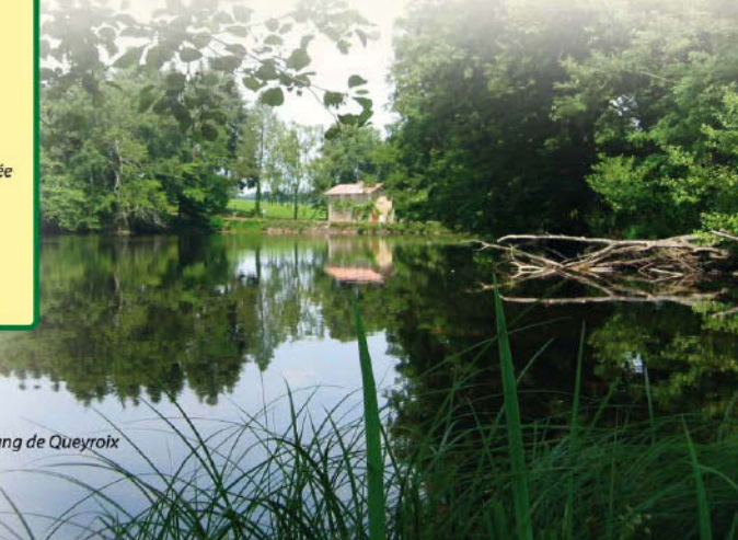
Etang de Queyroix