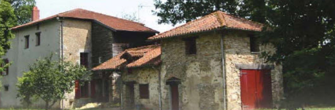
Moulin de Grange Neuve